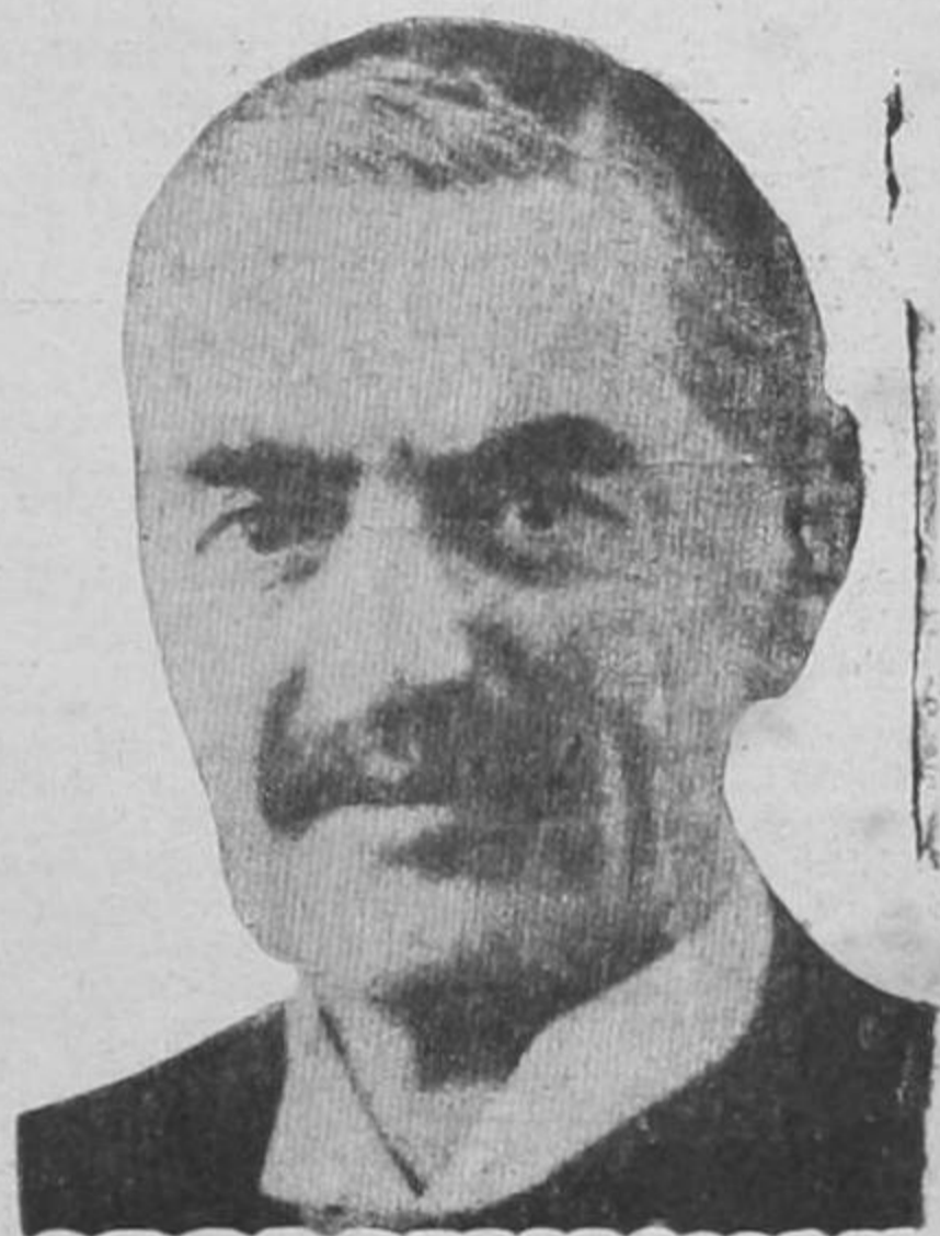
Gran Bretaña de continuar la guerra sin descansar en contra de Alemania, mientras por otra parte aseguró que la Gran Bretaña daría ayuda material a Finlandia, enviándole material de guerra además de aviones militares. El premier dijo que los fi-

LA GRAN VALENTIA Y DETERMINACION DE LEJERCITO FINLANDESE LE HA DADO VENTAJA Y SUPERIORIDAD SOBRE LAS FUERZAS COMBATIVAS DEL SOVIET.—